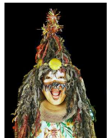
Portraits réalisés avec l'Ephad et la maison de quartier bois d'Artas de Grenoble