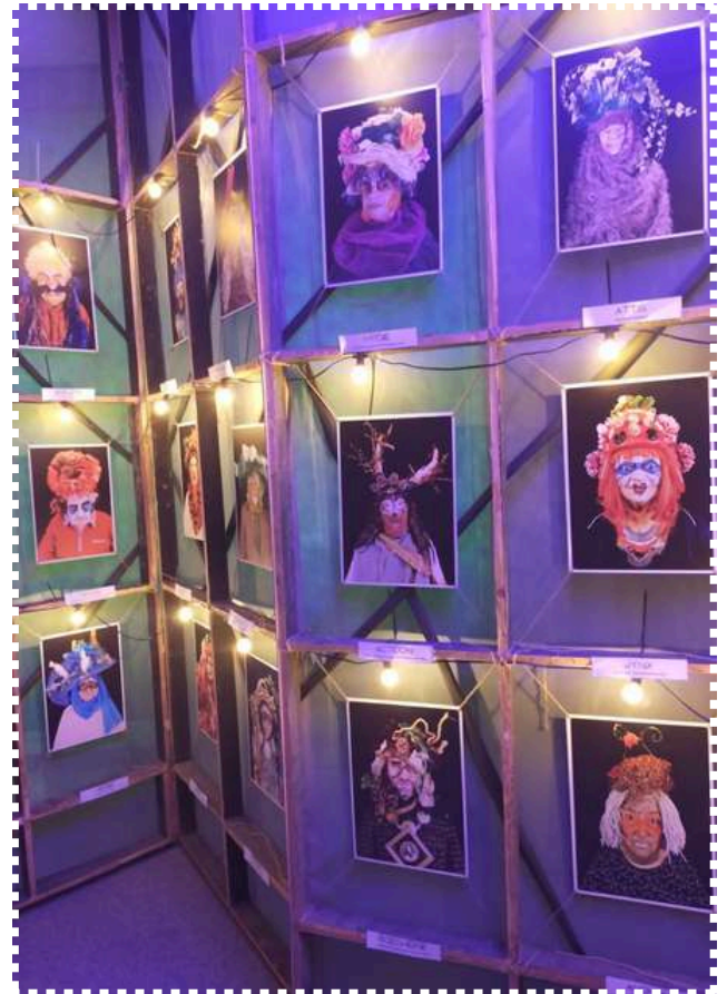
Installation du Momie dans le cadre de la Fête des Tuiles (Grenoble) - accessible pendant 2 semaines sur le Cours de la Libération