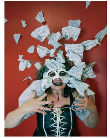
Portraits réalisés avec des résident.e.s du Centre Médical Rocheplane - Saint Martin d'Hères