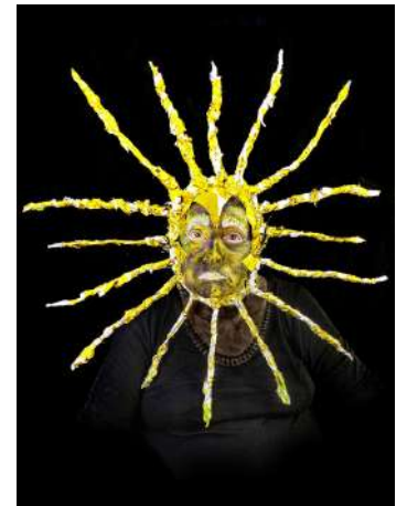
Portraits réalisés avec les résident.e.s de la Bretonnière - Dardilly et du Champ de courses - Tour-de-Salvagny