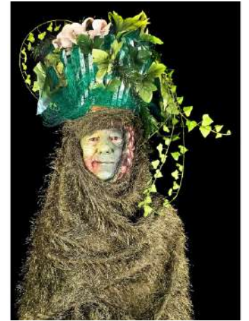
Portraits réalisés avec des des habitant.e.s de Grenoble